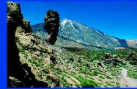
El Teide (Tenerife)