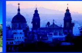
La Laguna (Tenerife)