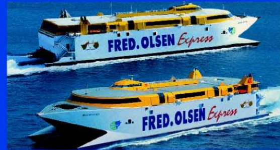
Bentago Express - Bencomo Express